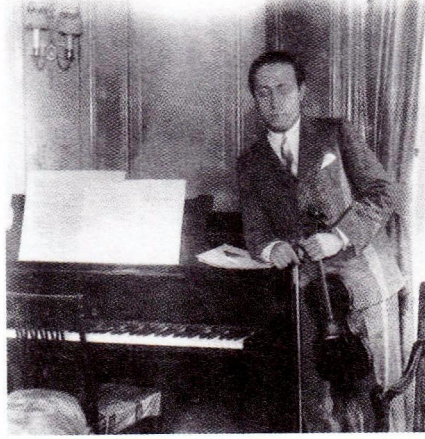
Jascha Heifetz'in 1 Ekim 1928 tarihinde, İstanbul konserlerinden bir ay önce çekilmiş bir fotoğrafı.