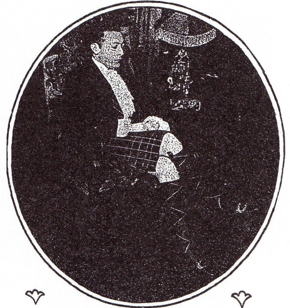
JASCHA HEIFETZ, the Violinist, Wears His Kilts, a Present From His Admirers in Scotland, Who Gave Them to Him as a Souvenir of His Recent Concerts in Glasgow.

21 Şubat 1926 tarihli New York Times gazetesinin "Fotogravure Picture Section" sayfasında yer alan gravürlerden ikisi. Solda ulu önder Atatürk, sağda ise 1925 yılının sonunda İskoçya'nın Glasgow kentinde sahneye çıkan Jascha Heifetz geleneksel İskoç eteğiyle.