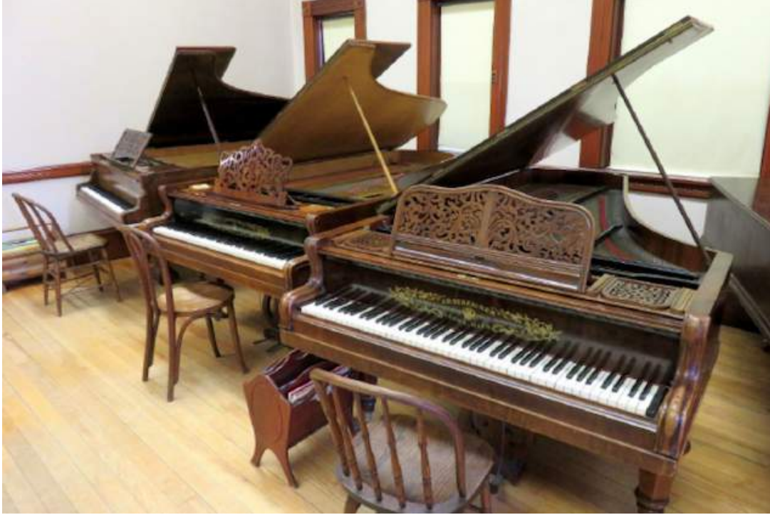
Frederick Tarihsel Piyanolar Koleksiyonu'ndan üç kuyruklu piyano. Soldan sağa: Ravel'in kullandığı model 1893 Erard; 1871 Streicher; Brahms'ın piyanosunun modeli 1868 Streicher.

Mike: Ohio'ya taşındıktan hemen sonra bir antikacıdan 18. yüzyıl sonu yapımı İrlanda yapımı dört köşe bir piyano satın aldık. Tamir edip çalar hale getirebileceğimi düşünüyordum. Mobilya olarak görünümü fena değildi, üstelik fiyatı da uygundu. İlk aldığımız antik piyano bu oldu. Daha sonra birkaç tane daha İrlanda ve İngiliz yapımı dört köşe piyano edindik. İlk kuyruklu piyanomuzu alış tarihimiz 1975. Bir İngiliz müzikoloji dergisinde eski piyano avcısı birinin reklamını görmüştüm, yazıp ne aradığımı söyledim, Chopin'in zamanından bir kuyruklu piyano arıyorum, dedim. İsteddiğimi bir zaman sonra buldu. Fiyatı da fena değildi. Yine de şimdi bildiklerimi o zaman biliyor olsam o kadar ödemezdim.