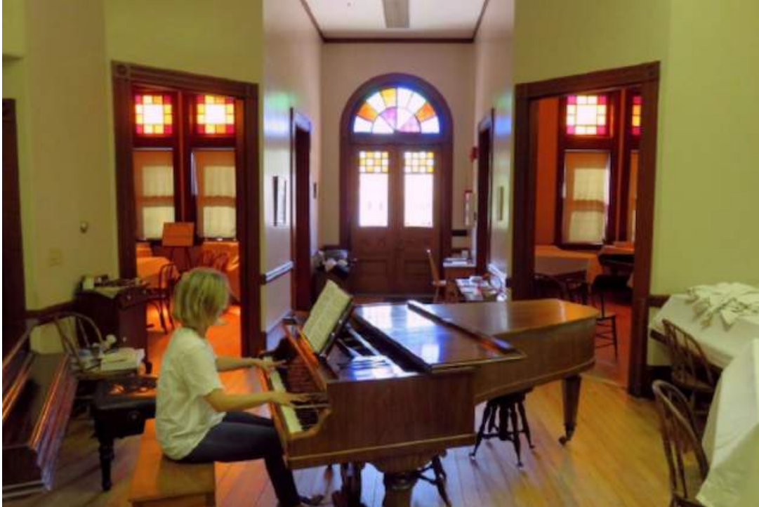
Frederick Tarihsel Piyano Koleksiyonu'nda bir kuyruklu piyano.

Pat: Uğraşyoruz. Piyano için hem ısı hem nem kontrolü sağlayacak, kendi konser salonu, atelye alanı, kütüphane ve dinleme odasına sahip bir yer arzu ediyoruz. Çok geniş kapsamlı bir kitap ve kayıt koleksiyonumuz da var.