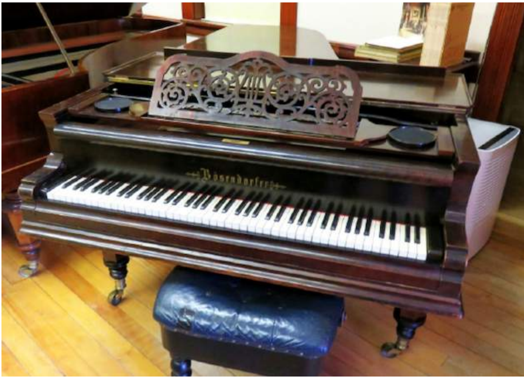
Frederick Tarihsel Piyanolar Koleksiyonu'ndan 1827 Bösendorfer kuyruklu piyano.