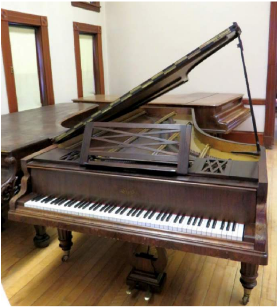
Frederick Tarihsel Piyanolar Koleksiyonu'ndan Ravel tarafından kullanılmıř 1877 "Extra-grand modèle de concert" Erard. 88 yerine kalın Sol ve Sol diyeze giden 90 tuřu var.