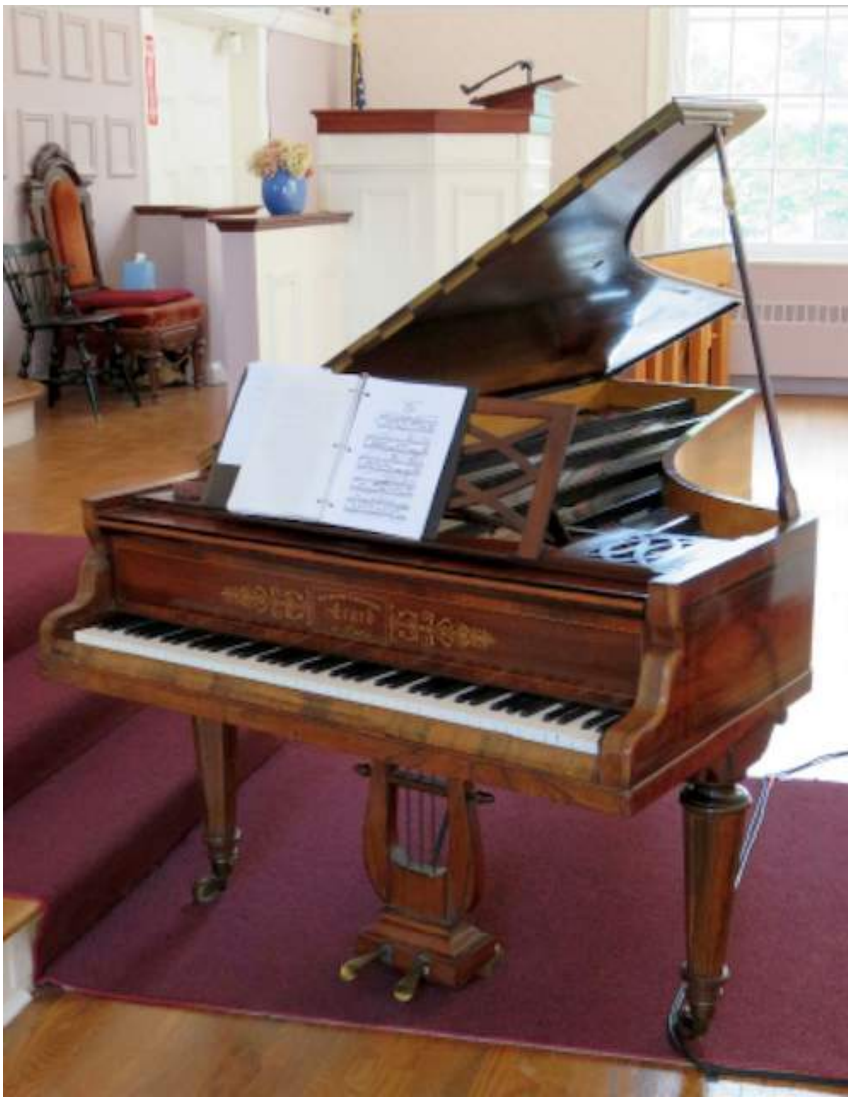
Frederick Tarihsel Piyano Koleksiyonu'ndan 1840 tarihli Erard (Paris) kuyruklu piyano.